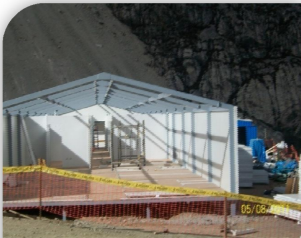
Instalación de los paneles para divisiones interiores en campamento.