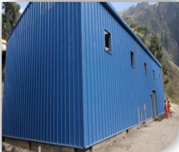
Vista de la Fachada Panorámica del taller Planta.