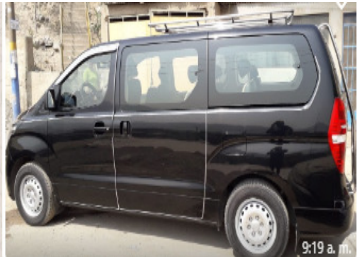
Movilidad para transporte de supervisores en campo y taller.