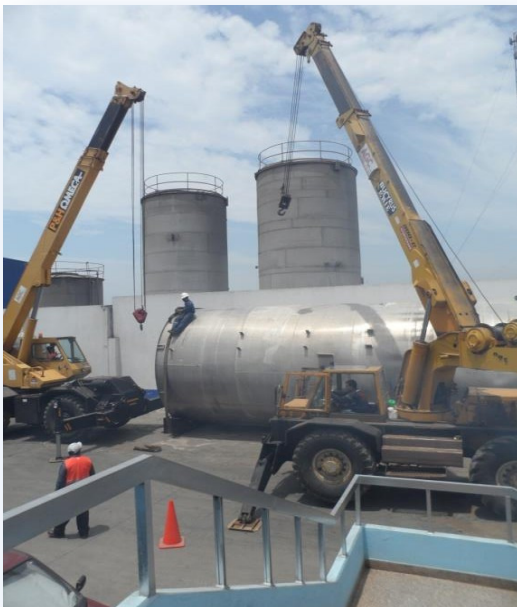
Levantamiento de los tanques