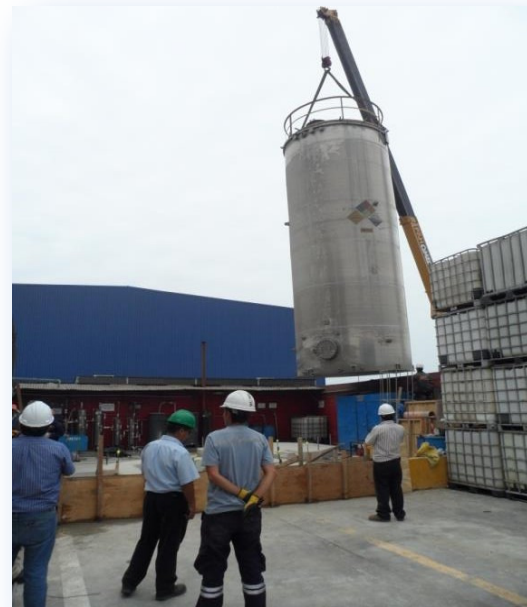
Izaje y Montaje de los tanques.