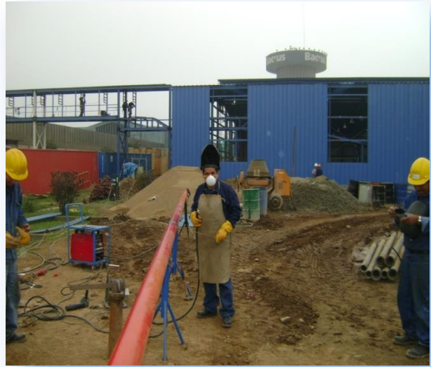
Preparación y soldadura de tuberías contra incendio para Planta de Gaseosas.