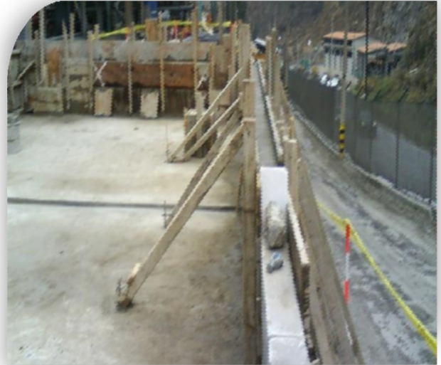
Trabajos civiles: Construcción de muros de contención.