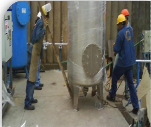
Instalación de equipos para la Planta de Osmosis, tales como tanque de almacenamiento de agua, tanque pulmón y equipo de ósmosis.