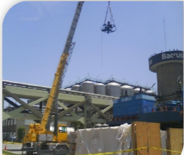
Desmontaje, mantenimiento y montaje de ventiladores para las torres de enfriamiento de planta fuerza.