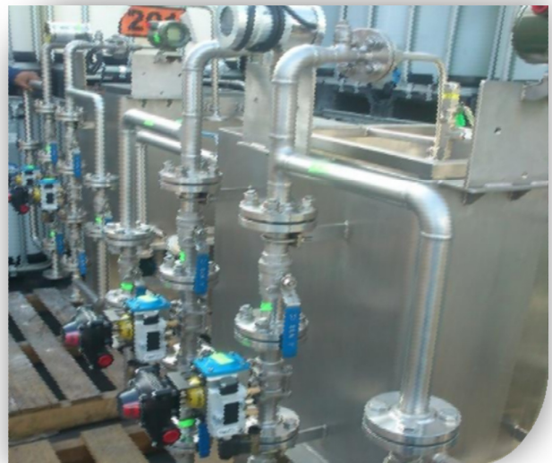
Ensamble de equipos para el Reactor de Acido de Caro.