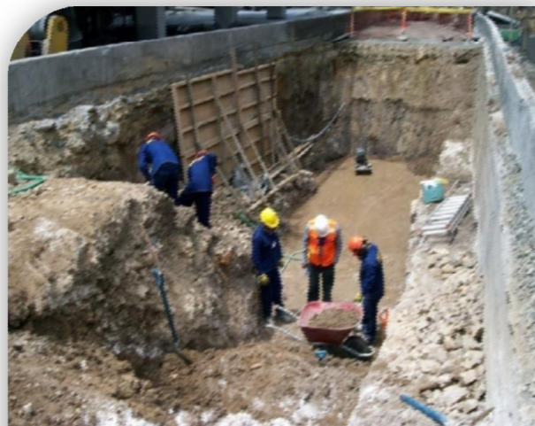
Trabajos de excavaciones profundas, estudio de suelos.