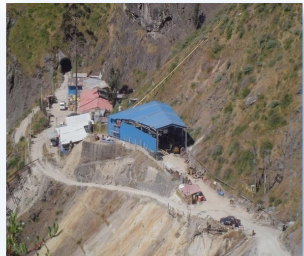
Vista del interior del taller.