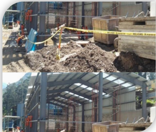
Instalación de canales C y coberturas PrecorTR4.