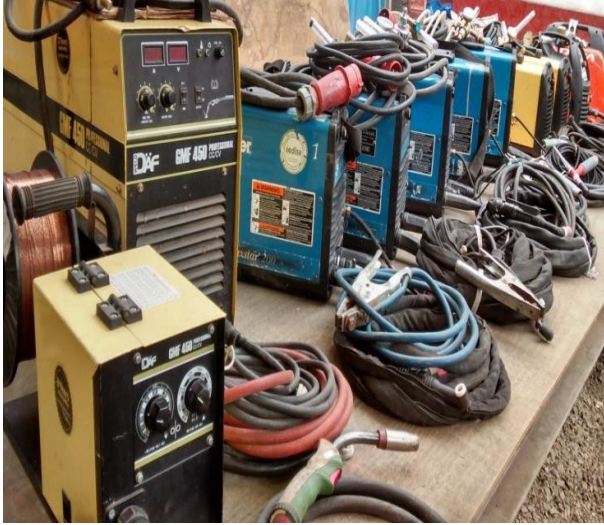
Máquinas de soldar TIG, MIG y eléctrica de marcas reconocidas tales como Miller, Kempf, Andina, Lyncoln, etc.

Metal Work Industrias S.A.C. cuenta con taller de material noble así como herramientas tales como máquinas de soldar, esmeriles, taladros manuales, taladros de banco, taladros magnéticos, maletines con herramientas, compresores, etc.