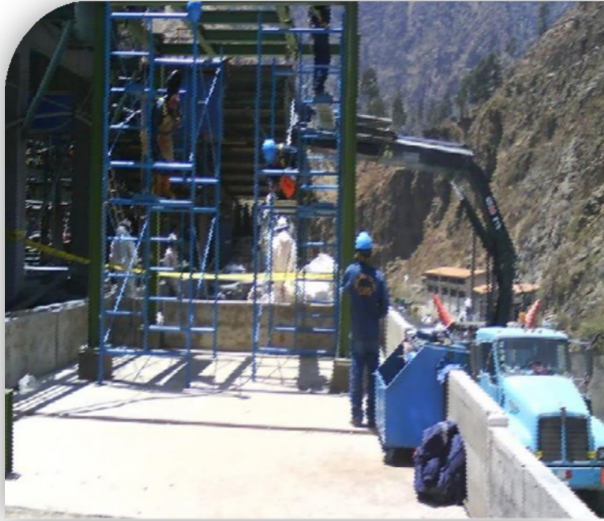
Trabajos Mecánicos: Montaje e Izaje de estructuras de plataforma.

Plataforma para Filtro Prensa de Cu (Ingeniería, diseño, fabricación y montaje CIVIL Y MECÁNICO)