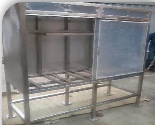
Fabricación de 6 skids en acero inoxidable para Dosificación de Peróxido, ácido sulfúrico, Metal bisulfito, Surfactante, Anti incrustante y Sulfato de Cu