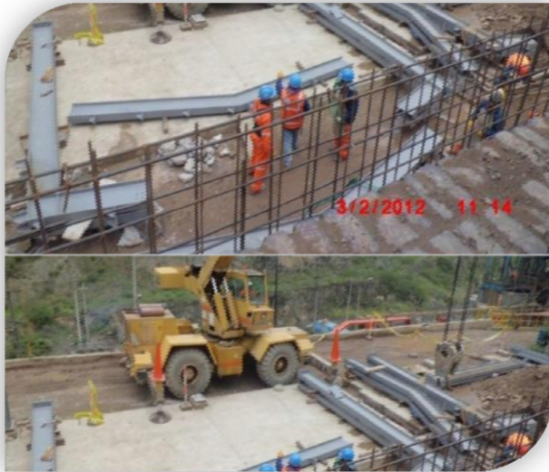
Montaje de los Pórticos del taller de Mantenimiento Planta. Peso Aprox. de estructuras 20 Toneladas.