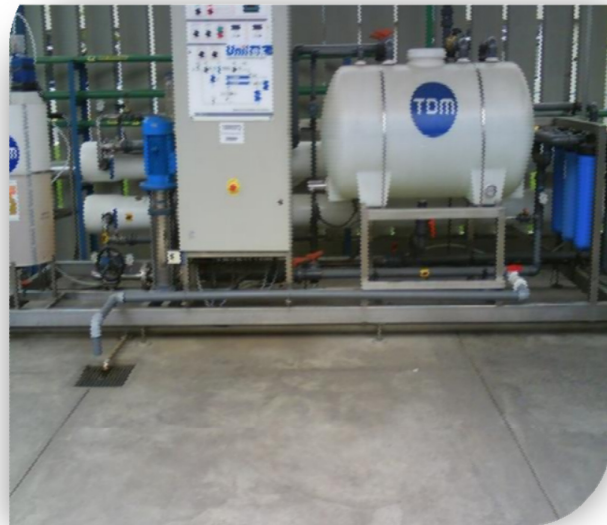
Trabajos de prueba y funcionamiento de Planta Piloto de Osmosis Inversa.