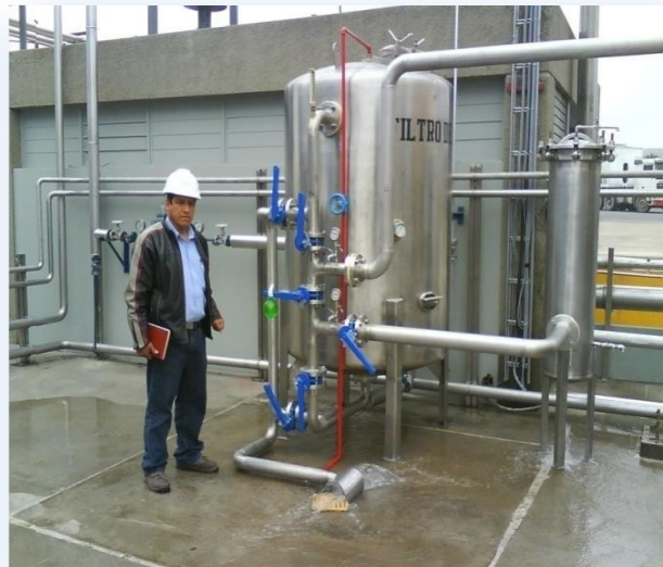
Instalación e interconexión de tuberías en Tanque Filtro Carbón.