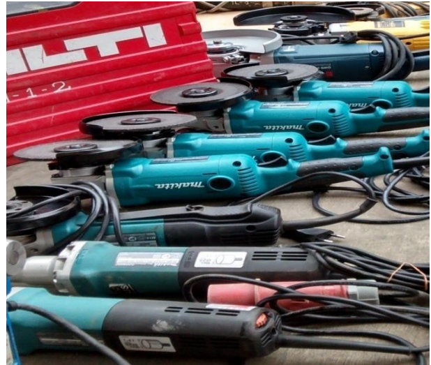
Esmeriles eléctricos de 4.1/2" y 7" de marcas reconocidas tales como Makita, Bosch, etc. Además contamos con taladros magnéticos, esmeriles de banco de 20"; dobladoras de tubo; compresores portátiles