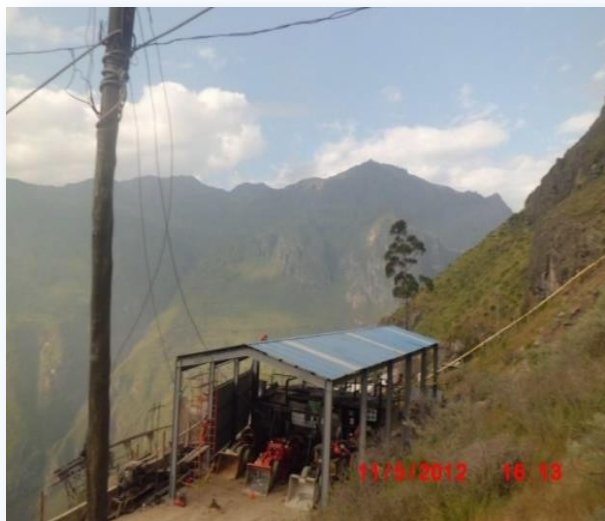
Vista panorámica del taller mantenimiento - Mina. Techo y cerramiento lateral con cobertura Precor TR4.