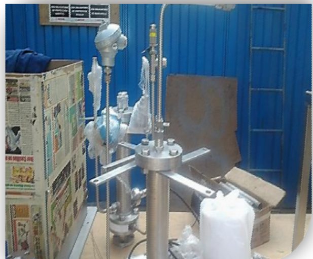
Fabricación de soporte para reactor