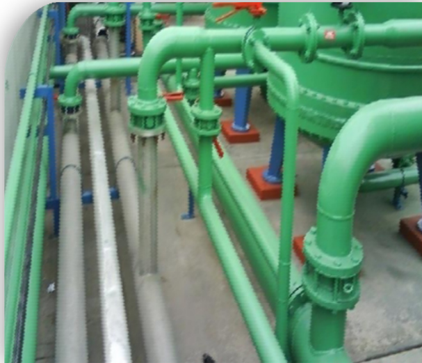
Instalación e interconexión de tuberías para agua ablandada, agua tratada, aire y vapor.