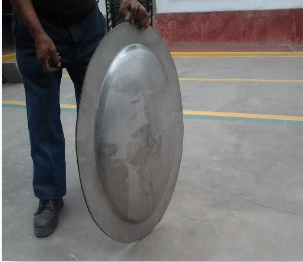
Fabricación e instalación de manhole para Tanque de levadura.