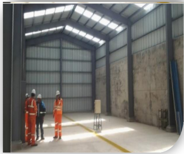
Vista del interior del taller.