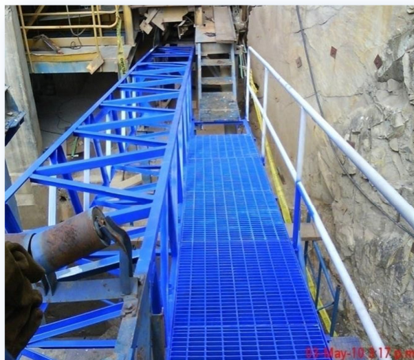
Fabricación e instalación de estructura para faja transportadora de minerales.