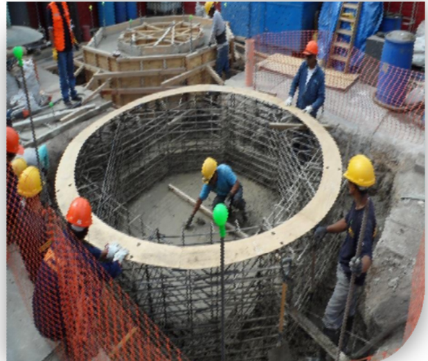
Ubicación e instalación de los pernos de anclaje