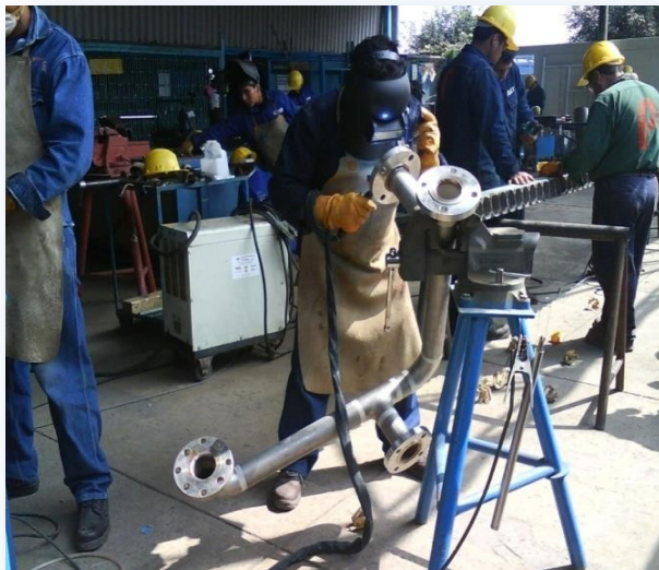
Preparación y soldadura de tuberías en Acero inoxidable C304 acabado sanitario.