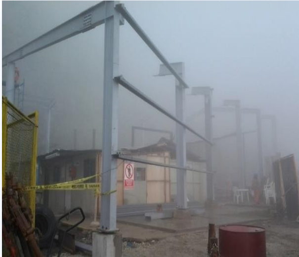
Montaje de estructuras metálicas. Peso aproximado de la estructura: 25 Ton.