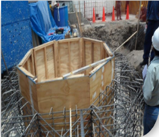
Obras Civiles: Bases de los Tanques de Almacenamiento.

Montaje de 02 tanques de almacenamiento de Peróxido de Hidrógeno de 120m 3 y 90m 3 e interconexión de tuberías de acero inoxidable 316L. (Ingeniería de detalle, diseño, fabricación y montaje civil y mecánico)