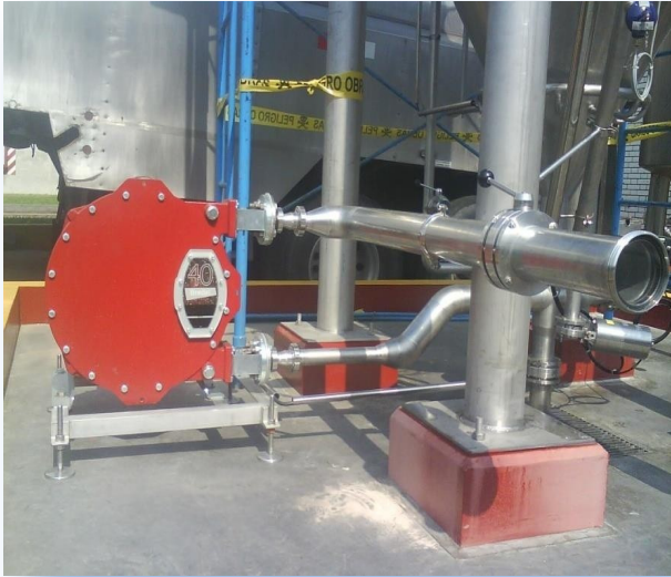
Montaje de bombas peristálticas.