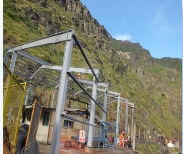
Montaje de estructuras metálicas. Peso aproximado de la estructura: 25 Ton.