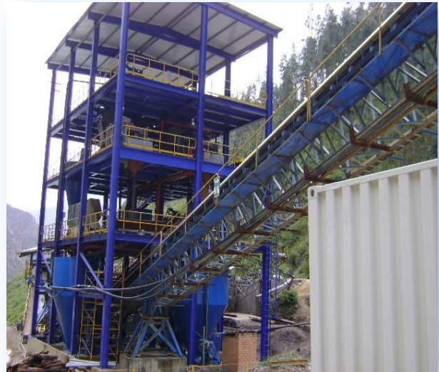
Reparación de Estructura en Edificio de Molienda.