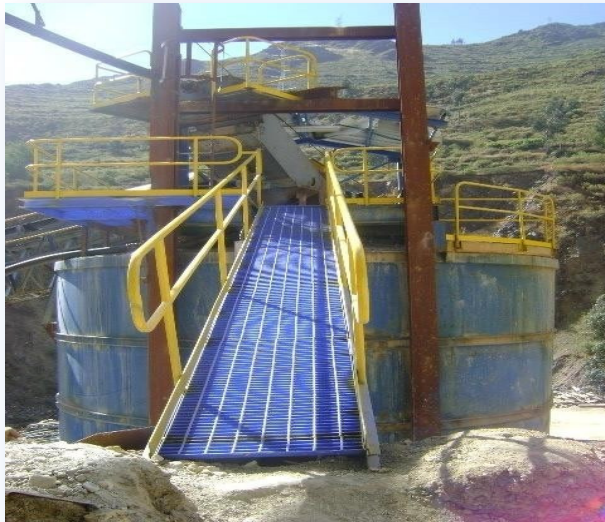
Cambio e Instalación de barandas y plataformas en Tolva de Finos.

Fabricación, Reparación e instalación de estructuras metalmecánica para Molienda en Aruri: Cambio de vigas, parrillas, barandas, escaleras tipo gato y de plataformas, estructura base para faja Transportadora, etc.