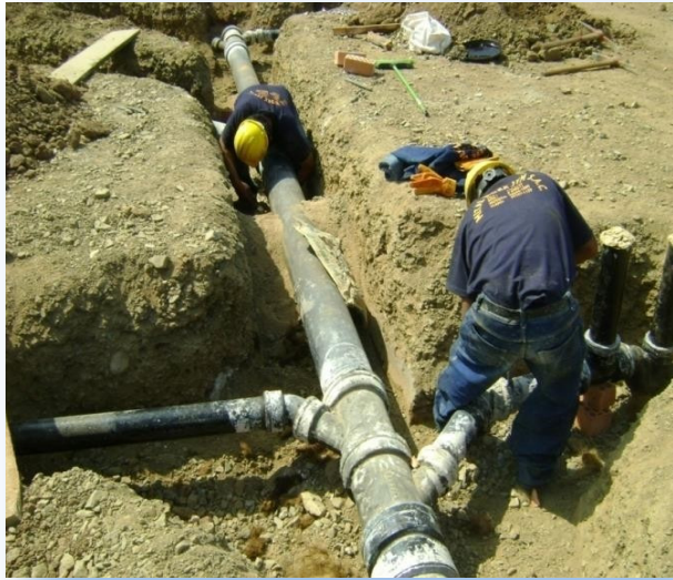
Preparación e instalación de tuberías de Fierro fundido para desagüe.