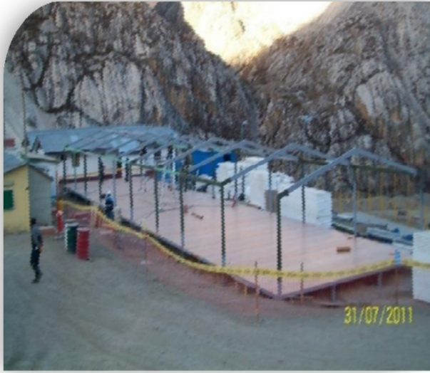
Montaje de las estructuras metálicas para el campamento.

Construcción de Modulo Staff Campamento Sur - Unidad Iscaycruz (Ingeniería de detalle, diseño, fabricación y montaje CIVIL Y MECÁNICO-ELÉCTRICO)