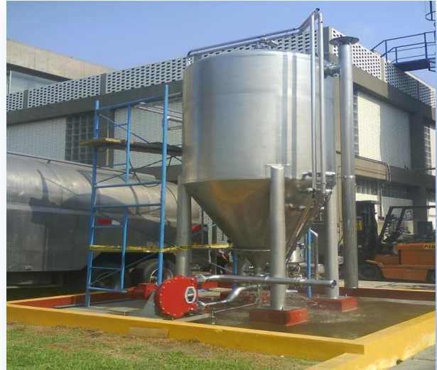
Instalación e interconexión de tuberías acero inoxidable para los tanques de jarabe de gaseosa.