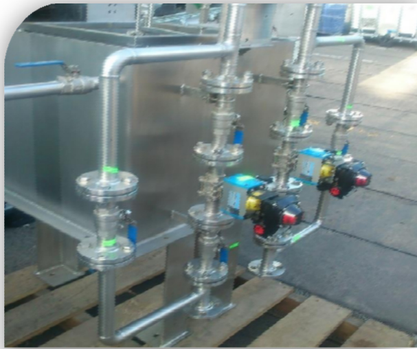
Fabricación de reactores de Acido de Caro.

Preparación e instalación de Reactor para preparación de ácido de Caro (Ingeniería de detalle, diseño, fabricación y montaje ELECTRO-MECÁNICO)