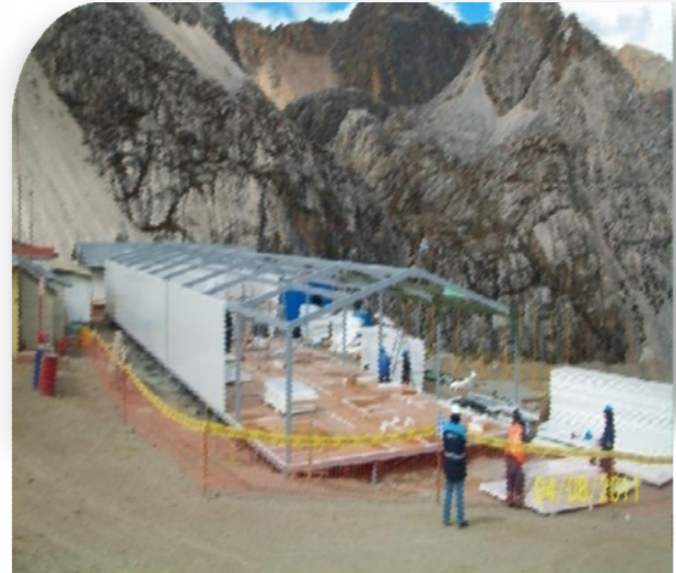
Montaje de los paneles termo-acústicos laterales para el campamento.