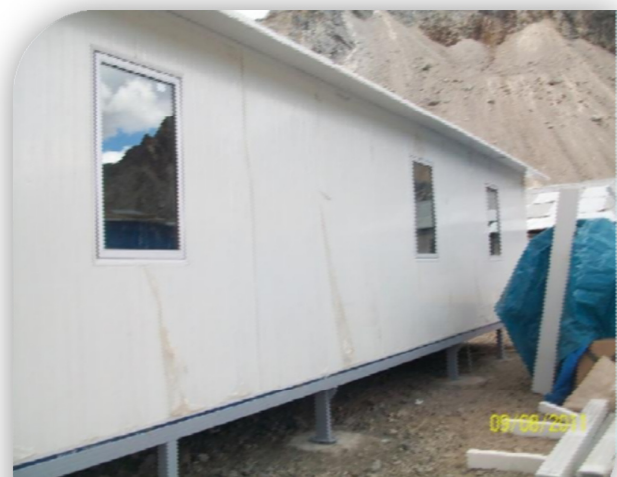
Instalación de accesorios tales como ventanas aislantes, canal de lluvias, termas, tuberías de desagüe.